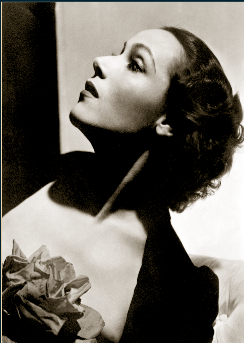
Dolores del Río, ca. 1935.