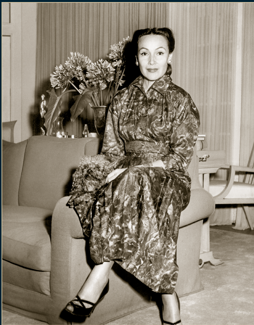
Dolores del Río. Actriz.