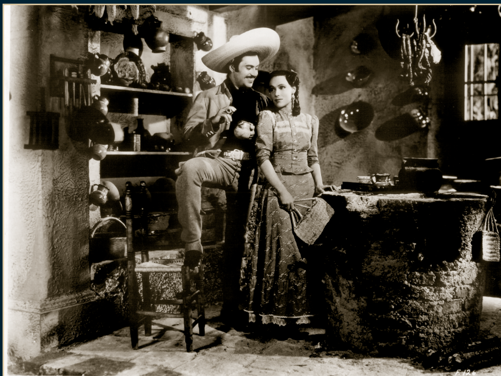
FILMS MUNDIALES, S.A. presenta a Dolores del Río en "FLOR SILVESTRE" Con Pedro Armendariz • Miguel Ángel Ferriz • "Launa" Mimi Derba • "El Chicote" • Eduardo Arozamena PRINTED IN U. S. A.

"Flor Silvestre", Fondo Dolores del Río, Archivo: FNH-0193-015. SECRETARÍA DE CULTURA-CINETECA NACIONAL.