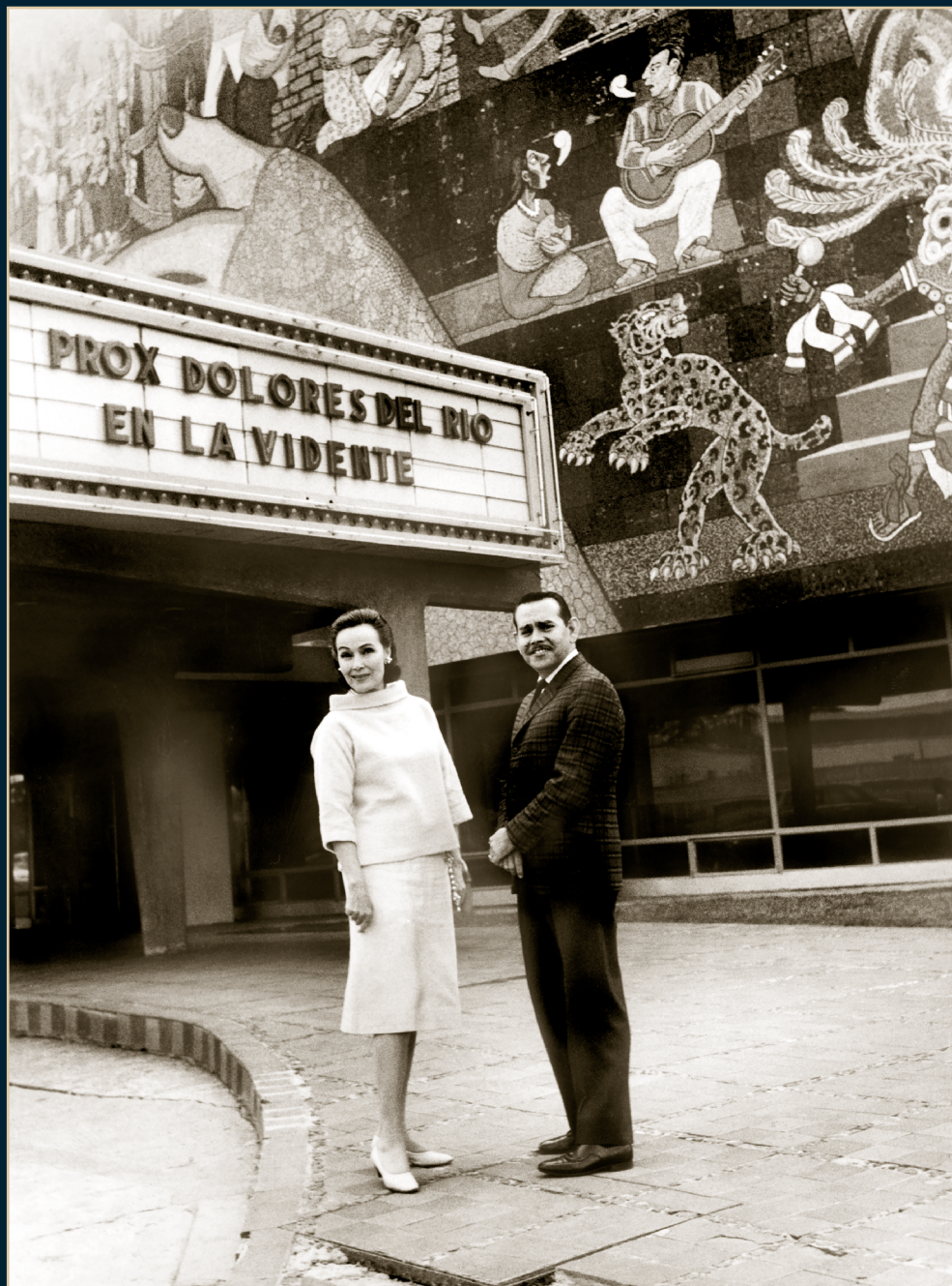
S/T, Fondo Dolores del Río, Álbum 11021, 1959, SECRETARÍA DE CULTURA-CINETECA NACIONAL.