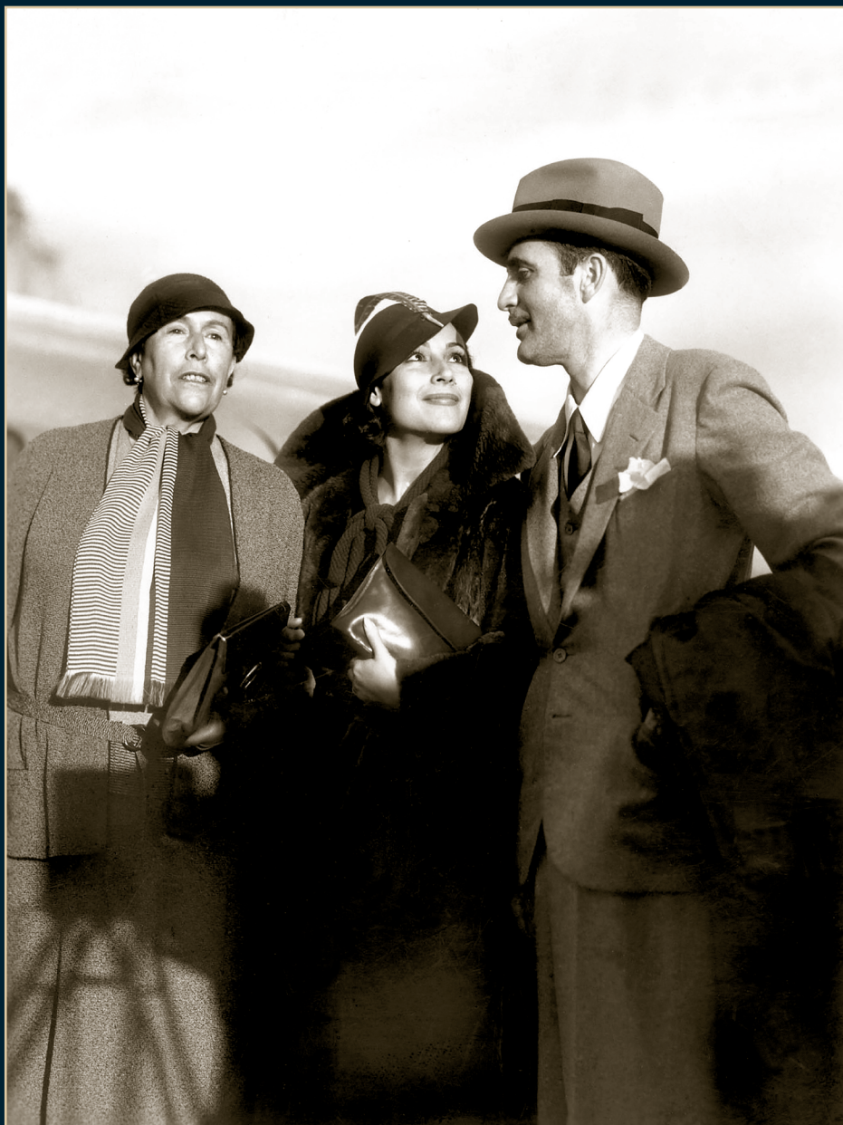
Acompañada de su madre y marido, Dolores del Río, artista mexicana de cine... No. Fondo: MXXIV-3. Fondo: Dolores del Río. Clasificación 090: MXXIV-3.8.871. Año: 1933-1935. S/1, 1934. Serie: Fotografías.