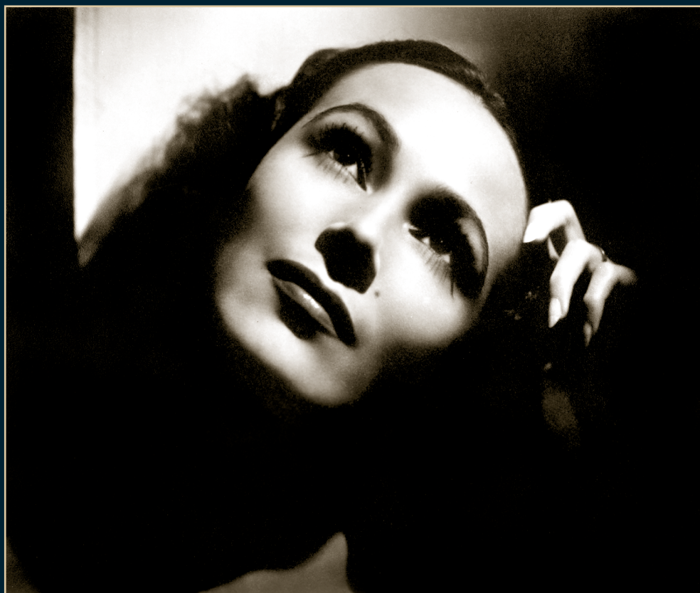
Dolores del Río. 22 de abril de 1936.