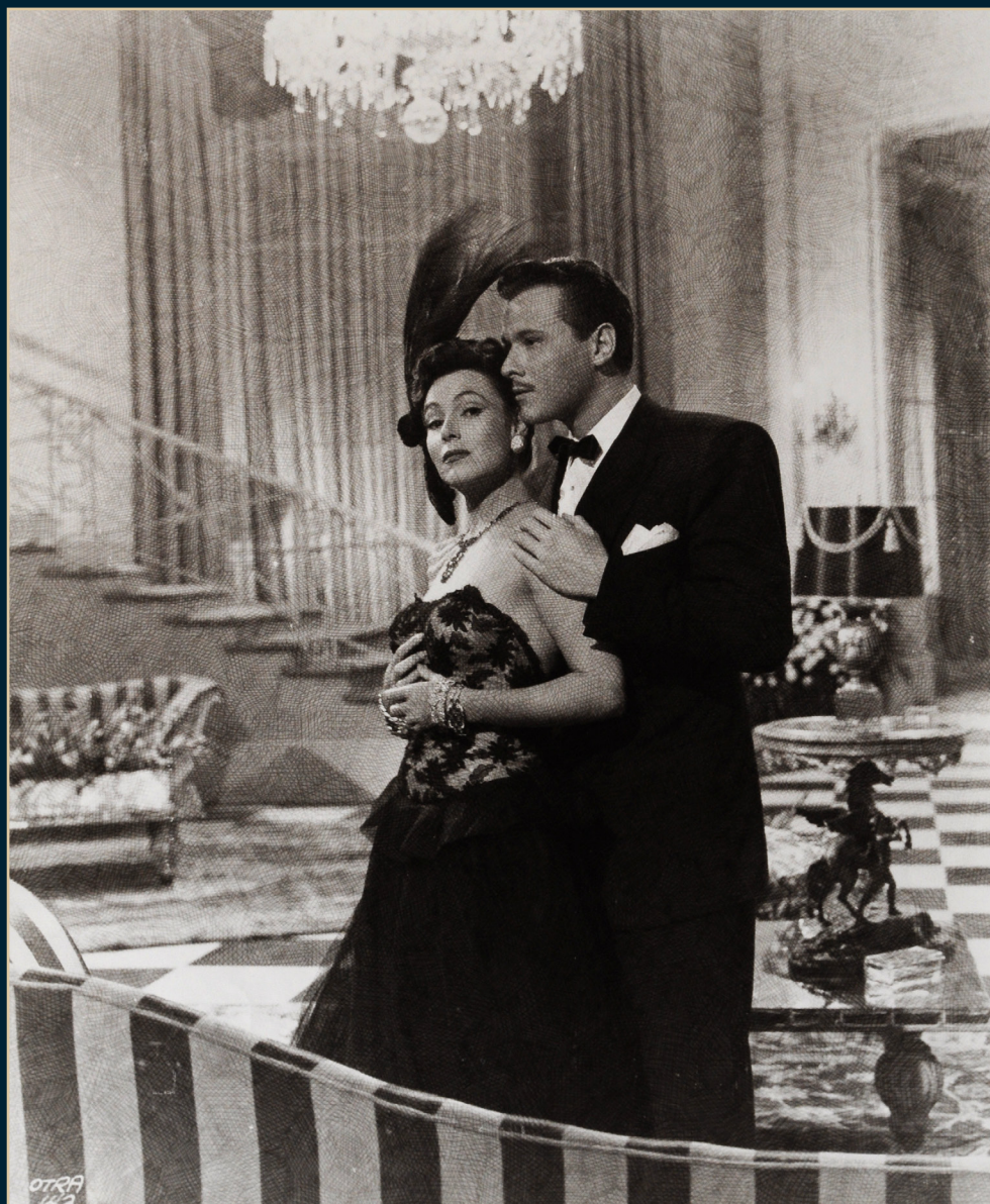
"La Otra", Fondo Dolores del Río, Archivo: FNH-0276-003. SECRETARÍA DE CULTURA-CINETECA NACIONAL.