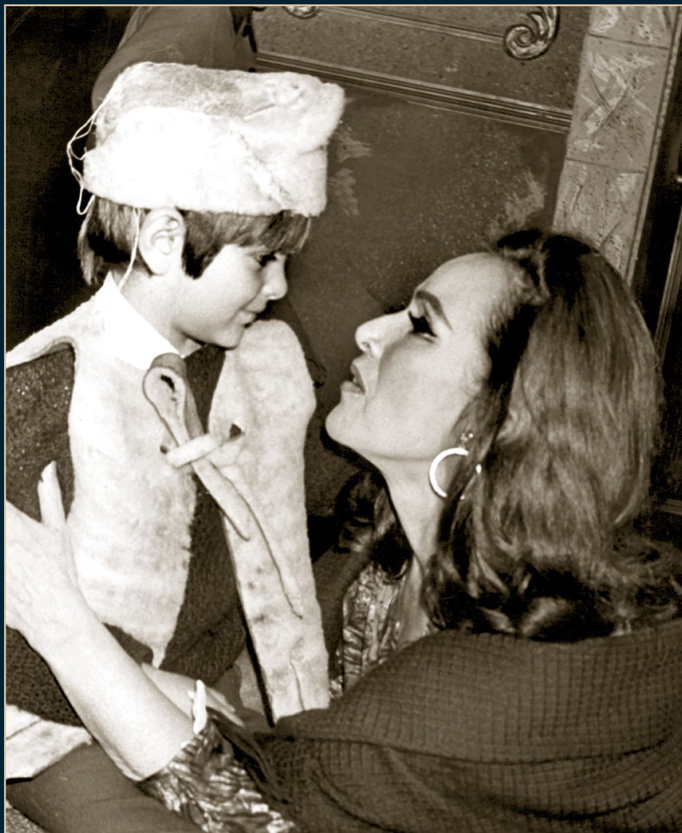
Dolores del Río. Escena de La Reina y los Rebeldes, 9 de octubre de 1967.