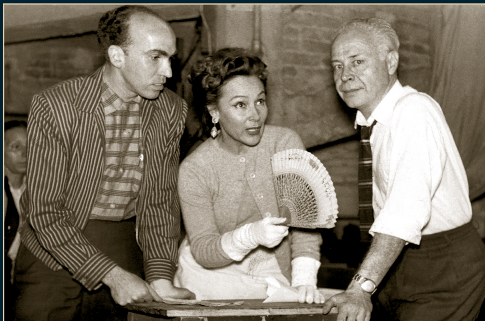
El abanico de Lady Windermere. 19 de junio de 1958.