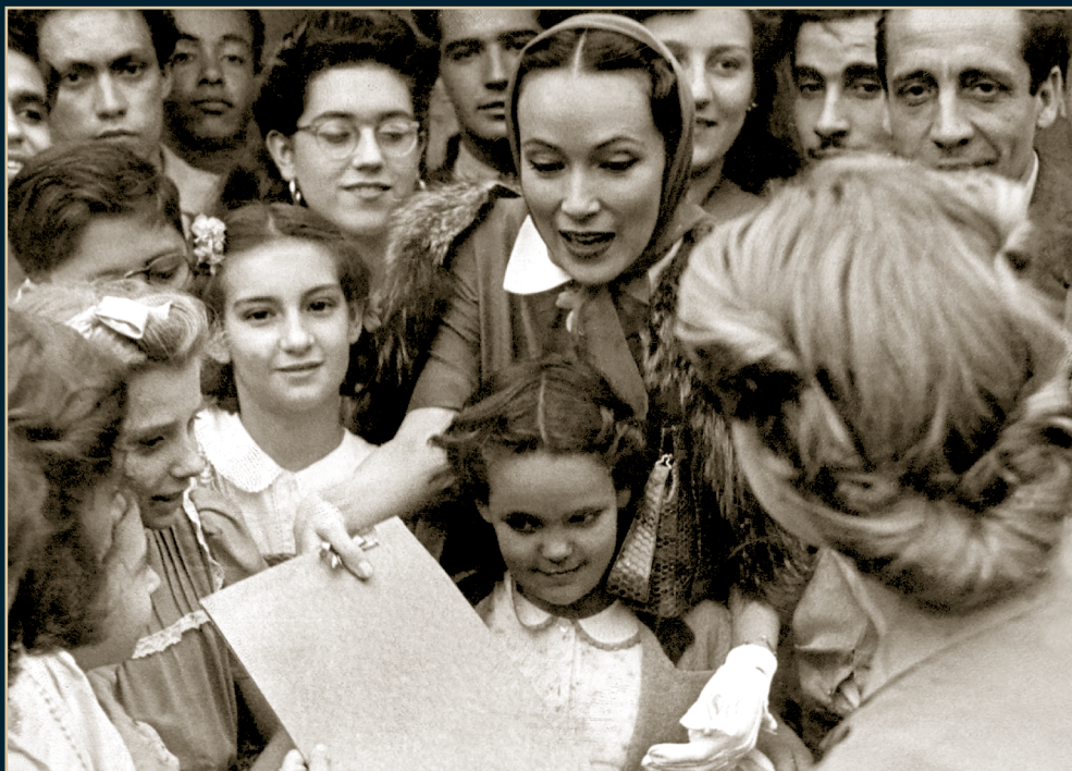
Dolores del Río, recibiendo del Instituto "Luis Vives" fotografías del Colegio, 28 de octubre de 1979.