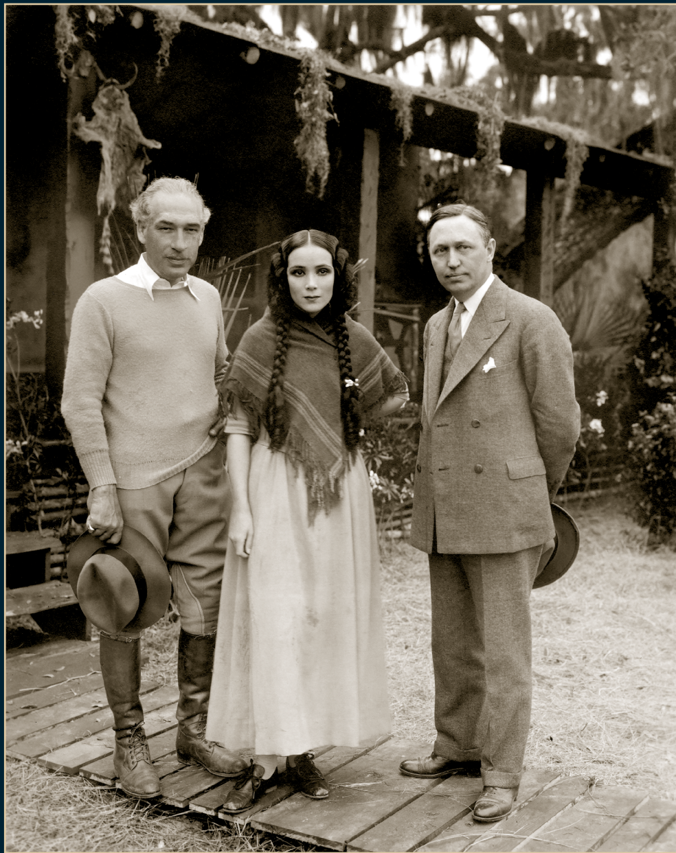
Edwin Carewe, Dolores Del Río. Evangelina . No. Fondo: MXXIV-3. Fondo: Dolores del Río. Clasificación 090: MXXIV-3.6.649. Año: 1928-1929. S/I, 1929. Serie: Fotografías. CEHM-Carso.