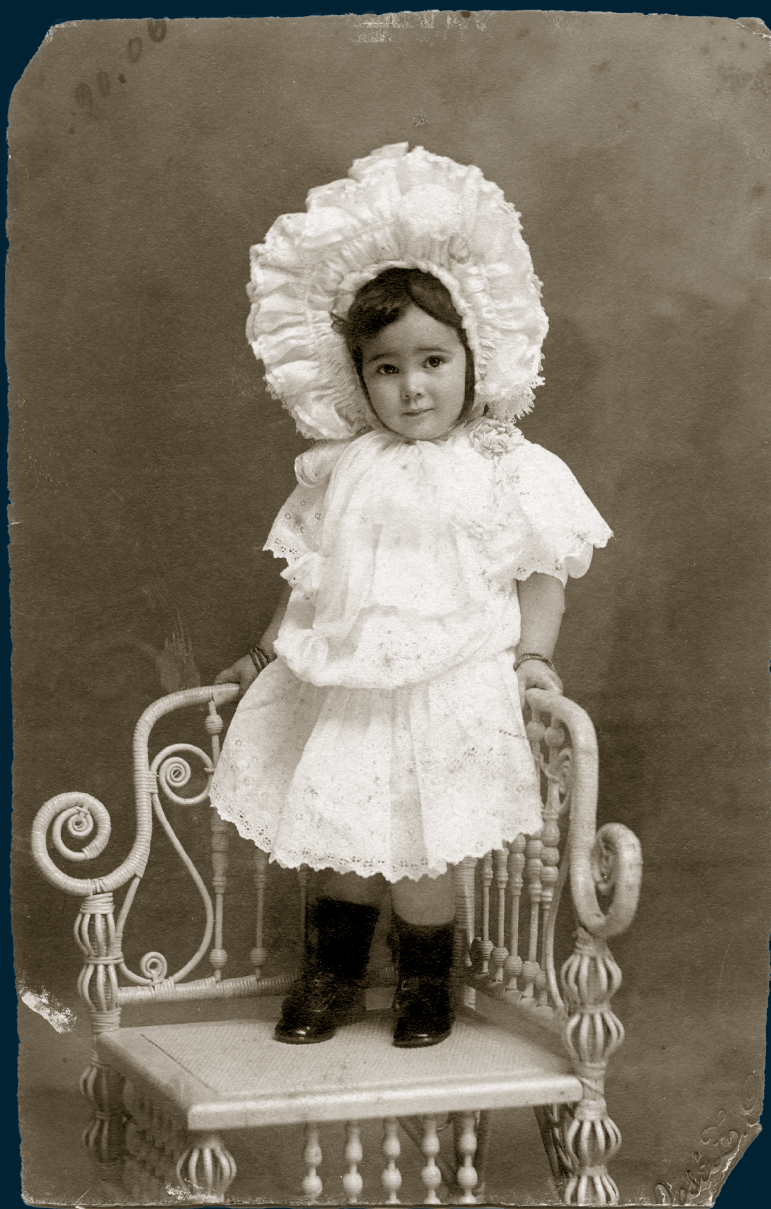
Dolores Asúnsolo López Negrete. No. Fondo: MXXIV-3. Fondo: Dolores del Río. Clasificación 090: MXXIV-3.1.7. Año: 1904-1923. Durango, s/f. Serie: Fotografías. CEHM-Carso.