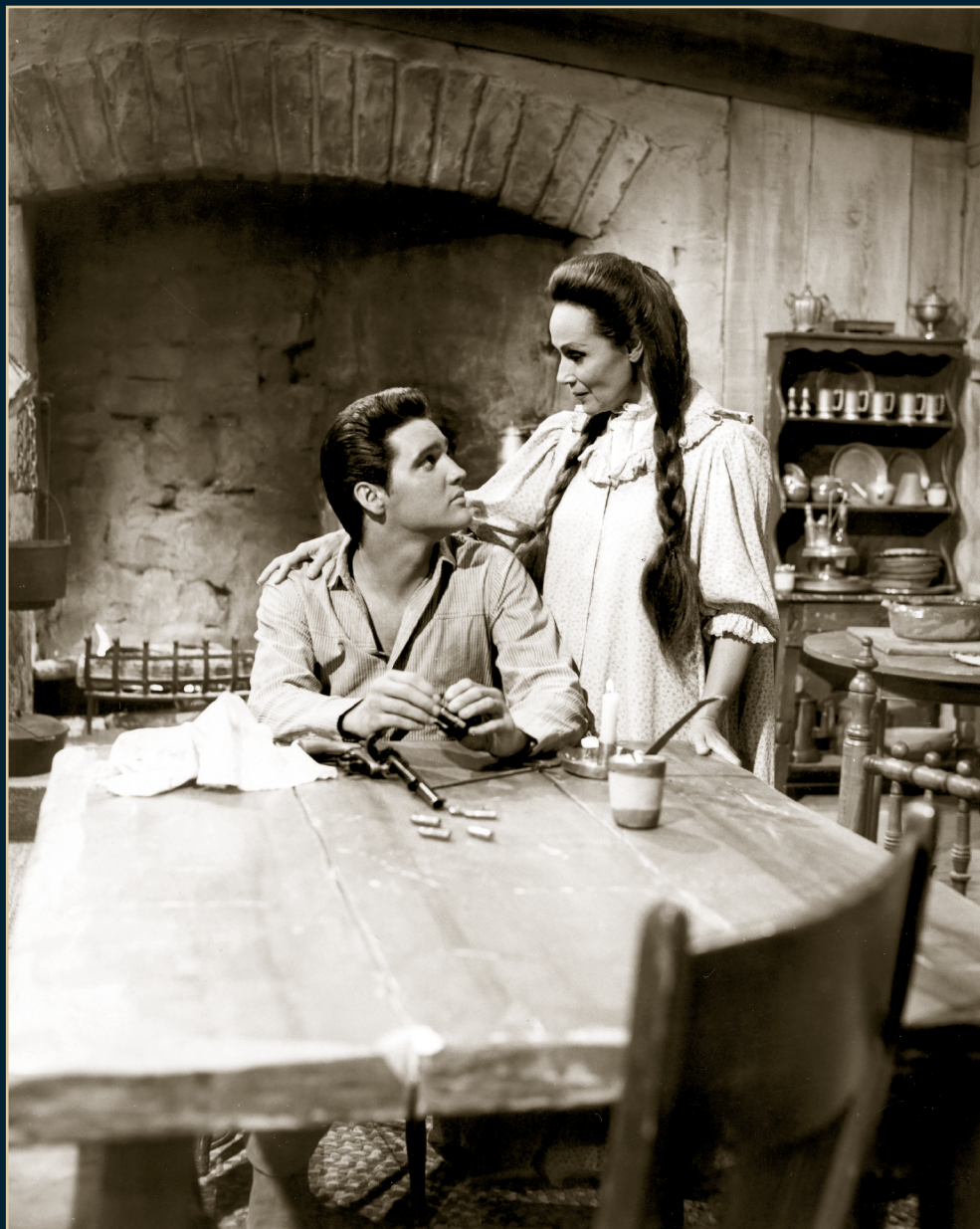
Dolores del Río y Elvis Presley en escena de la película ( Flaming Star) Estrella de fuego. No. Fondo: MXXIV-3. Fondo: Dolores del Río. Clasificación 090: MXXIV-3.17.1760. Año: 1958-1962. S/1, 1924. Serie: Fotografías.