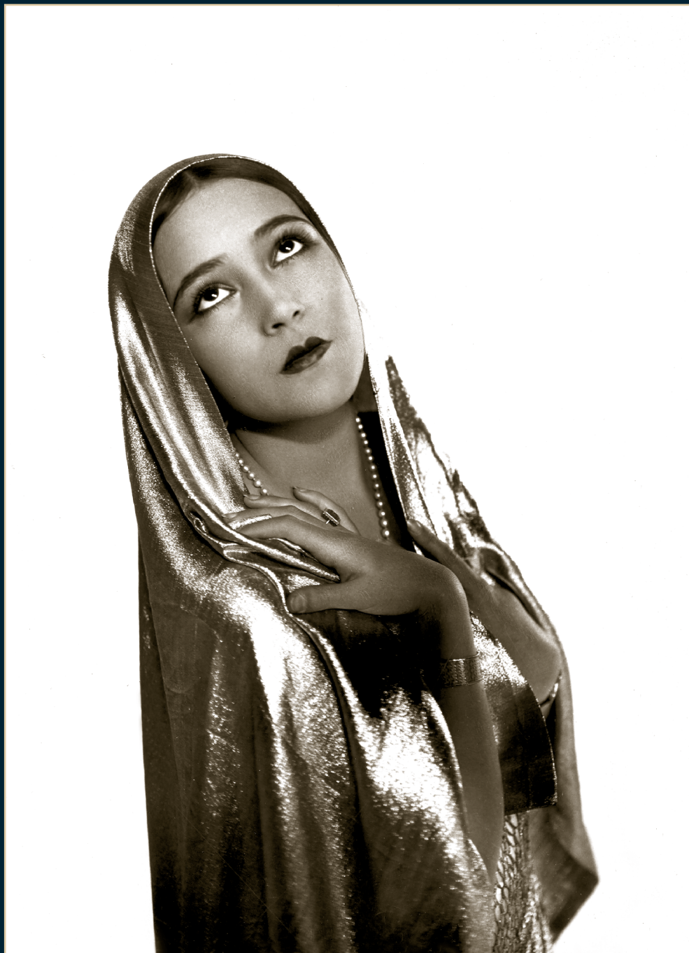
Dolores del Río. No. Fondo: MXXIV-3. Fondo: Dolores del Río. Clasificación 090: MXXIV-3.2.250. Año: 1923-1926. S/l, 1924. Serie: Fotografías.