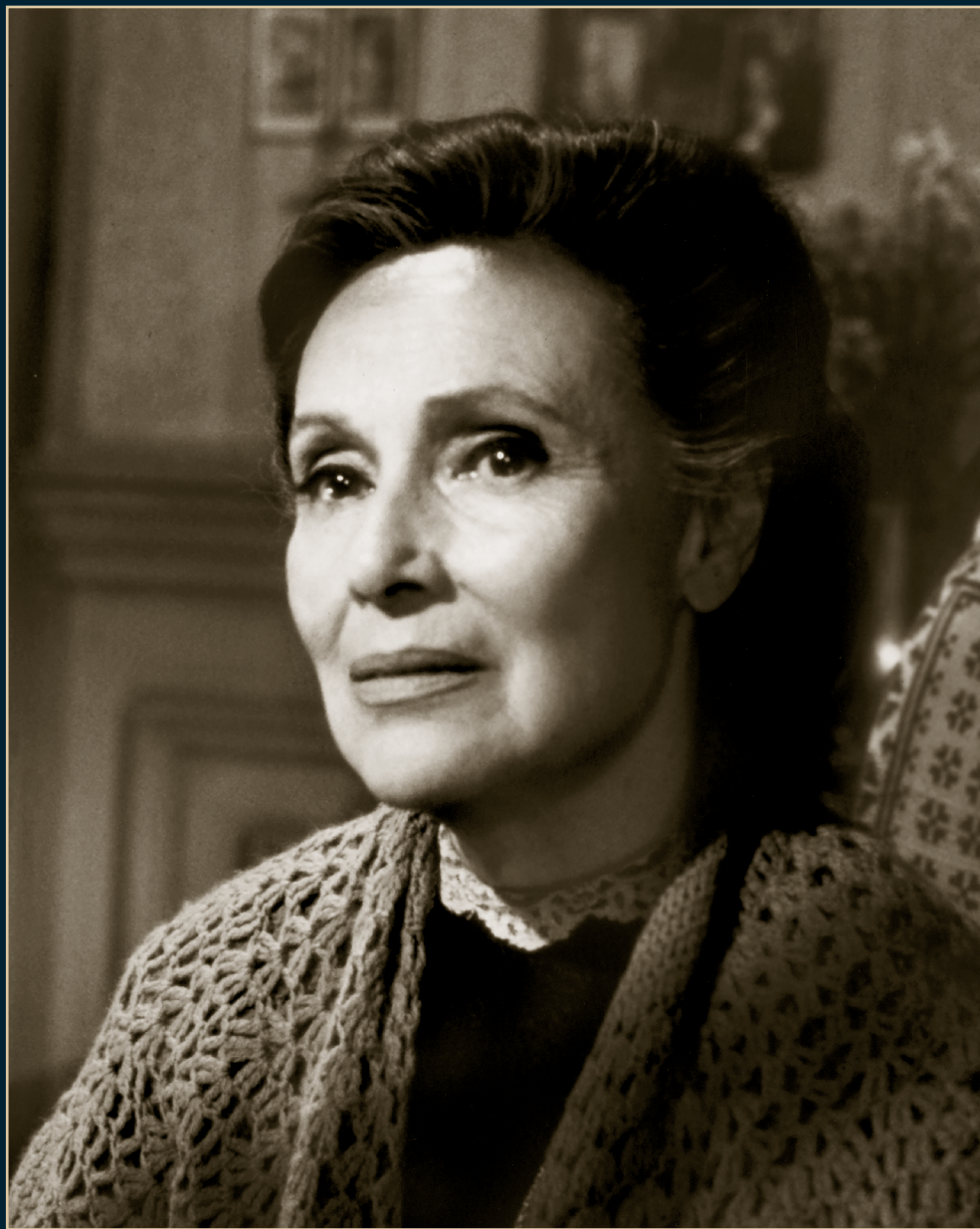
S/T, Fondo Dolores del Río, Álbum 11021. SECRETARÍA DE CULTURA-CINETECA NACIONAL.