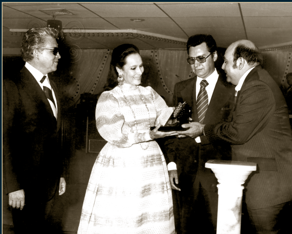
Momentos. 2 de junio de 1976.