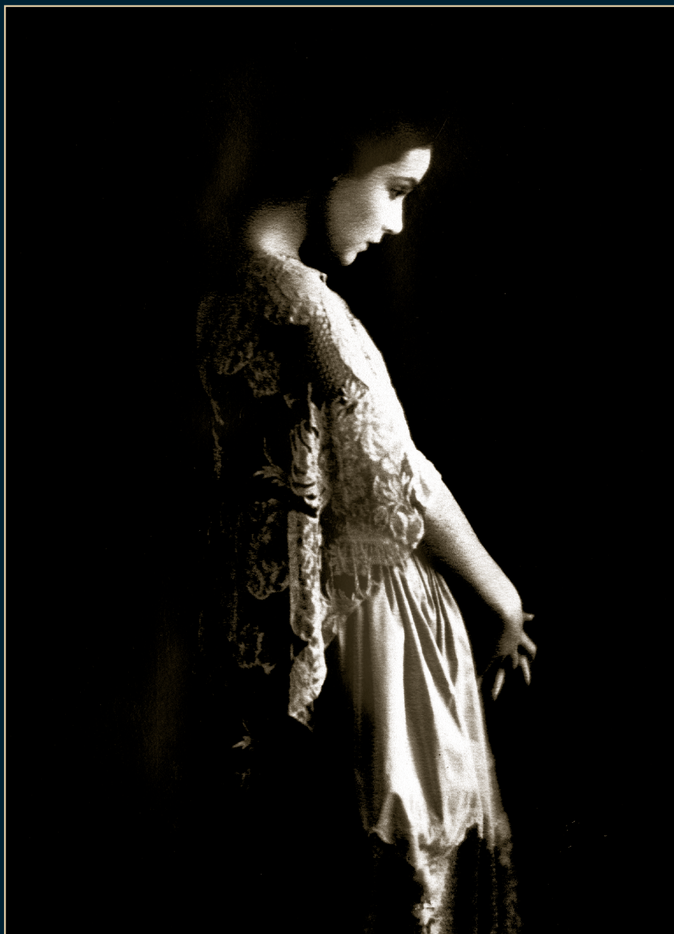
S/T, Fondo Dolores del Río, Álbum 11021, 1919, SECRETARÍA DE CULTURA-CINETECA NACIONAL.