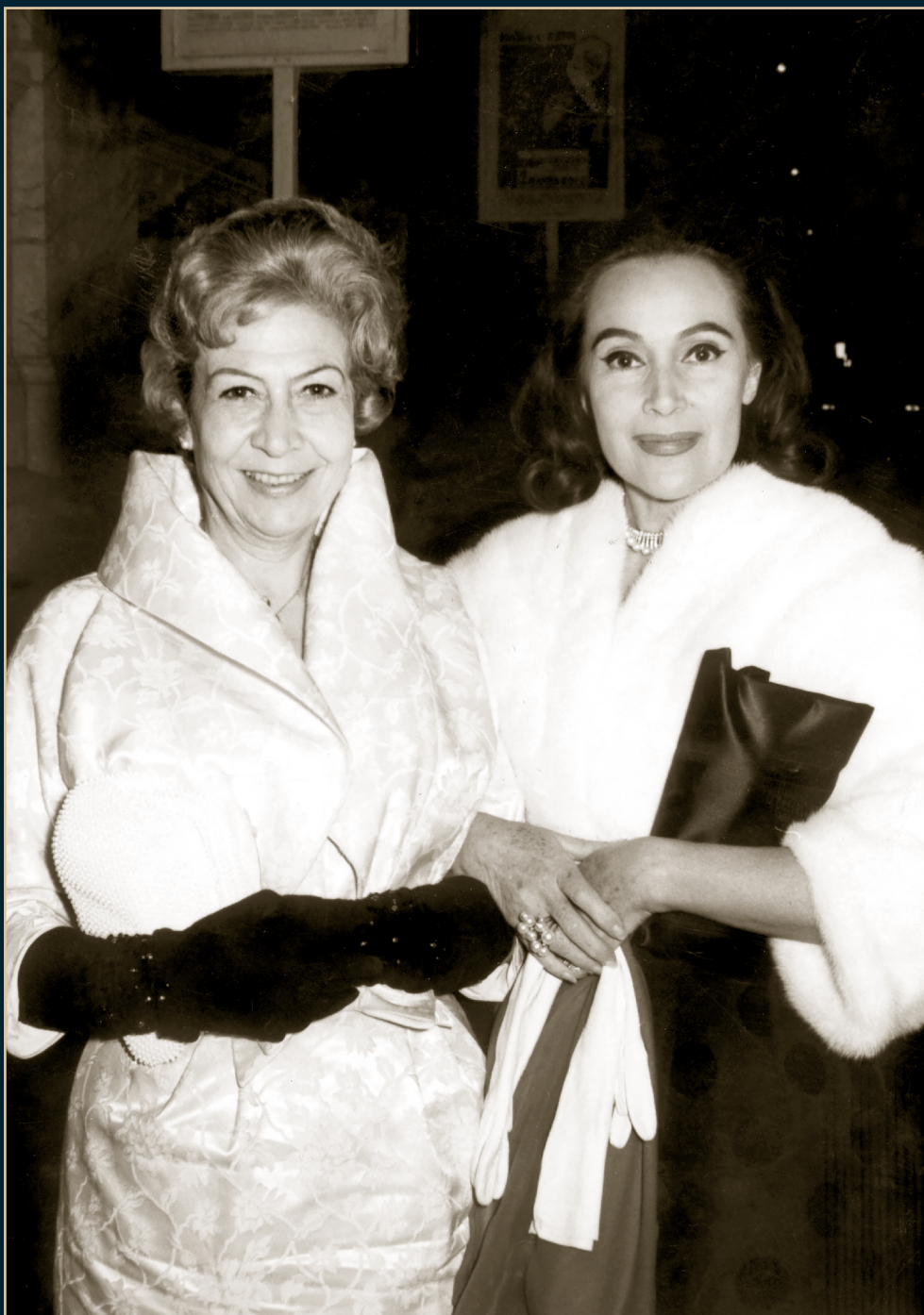
Dolores del Río en el XXIV Festival de San Sebastián. No. Fondo: MXXIV-3. Fondo: Dolores del Río. Clasificación 090: MXXIV-3.24.2337, S/L. Año: 1976-1980. Serie: Fotografías. CEHM-Carso.