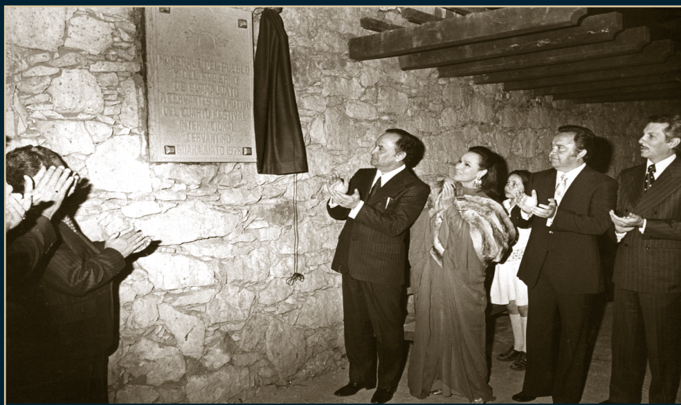
S/T. 30 de abril, Guanajuato.