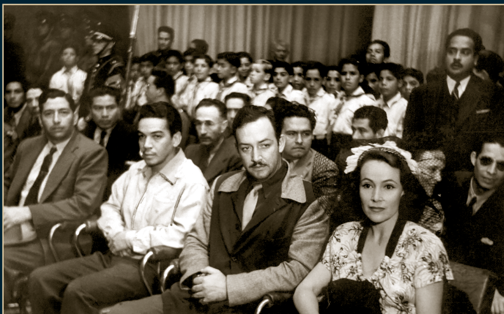
Dolores del Río (a su lado Jorge Negrete y Mario Moreno “cantinflas”). 1945.