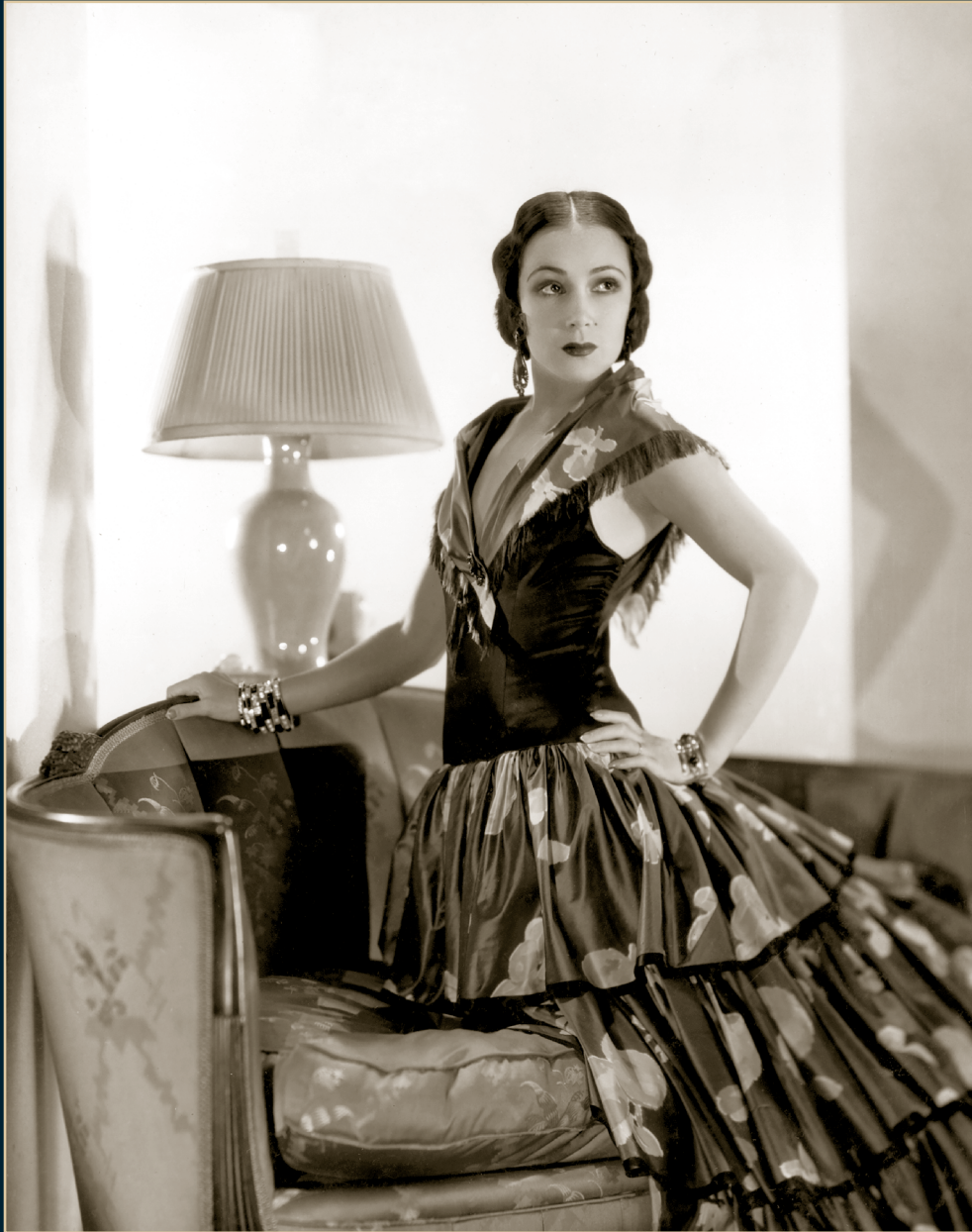
S/T, Fondo Dolores del Río, Álbum 1107, 1931, SECRETARÍA DE CULTURA-CINETECA NACIONAL.