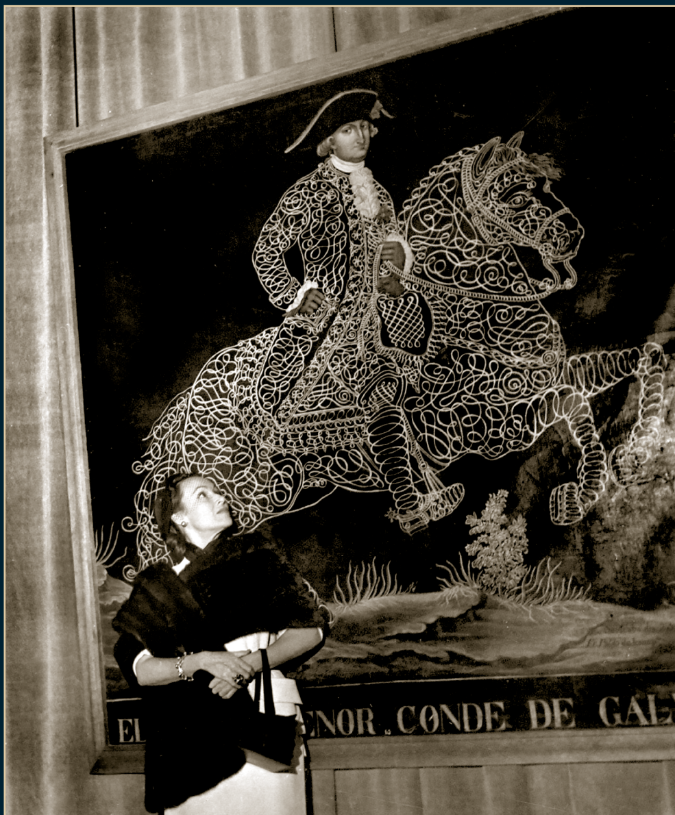
Dolores del Río visitando la Exposición. 13 de agosto.