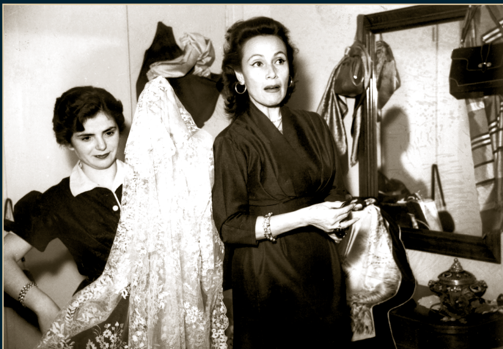
Dolores del Río. ca. 1970.