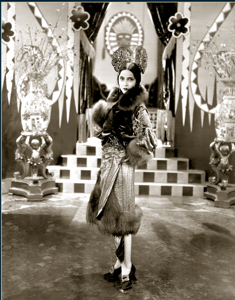
S/T, Fondo Dolores del Río, Álbum 1107, 1931, SECRETARÍA DE CULTURA-CINETECA NACIONAL.