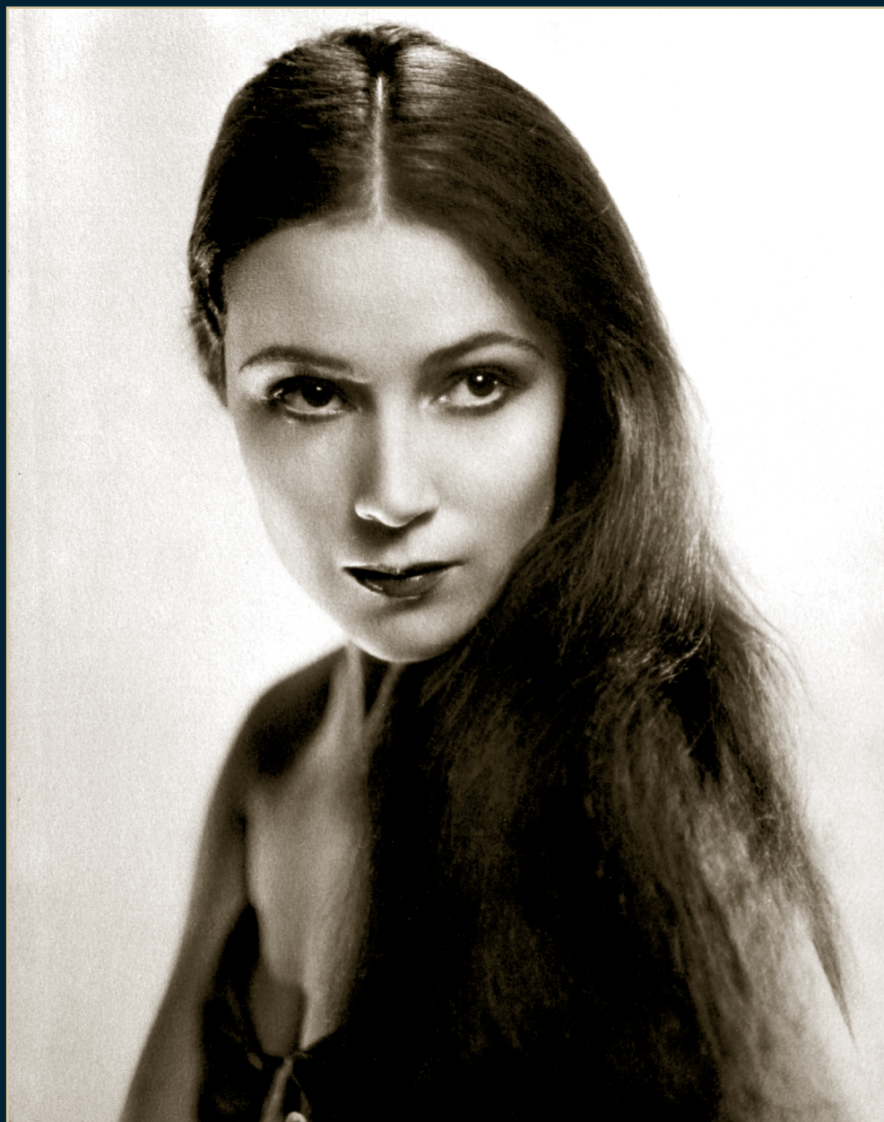
Dolores del Río, en la película La senda del 98 o Cenizas de gloria... No. Fondo: MXXIV-3. Fondo: Dolores del Río. Clasificación 090: MXXIV-3.5.554. Año: 1927-1928. S/I, 1928. Serie: Fotografías.