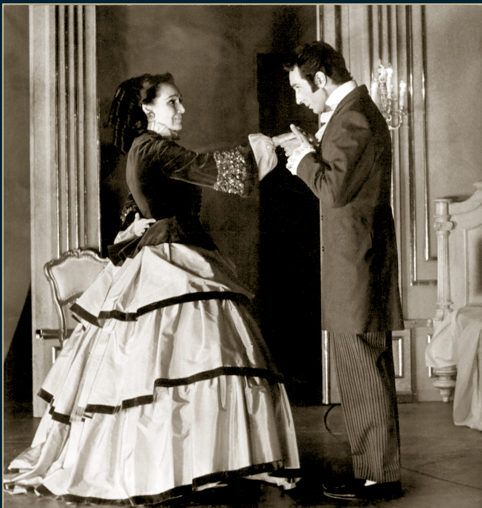
Dolores del Río, acompañada de Germán Robles de una escena de la pieza teatral La Dama de las Camelias. 13 de abril de 1983.