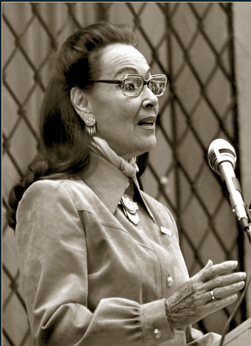
Dolores del Río. 13 de noviembre de 1975.