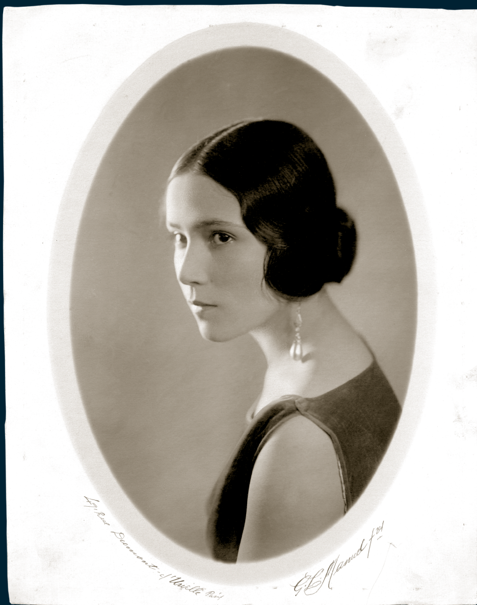
Dolores Asúnsolo López Negrete. No. Fondo: MXXIV-3. Fondo: Dolores del Río. Clasificación 090: MXXIV-3.1.54. Año: 1904-1923. S/1, 1920. Serie: Fotografías. CEHM-Carso.