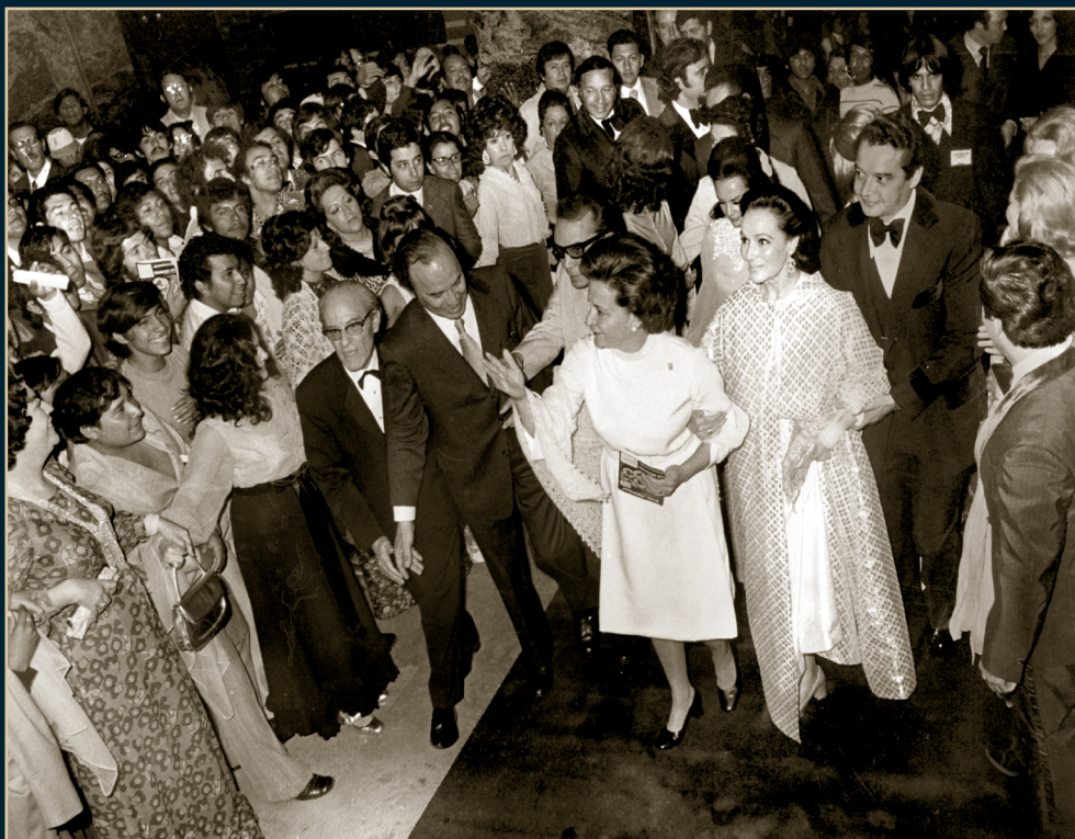
S/T. 28 de junio de 1979.