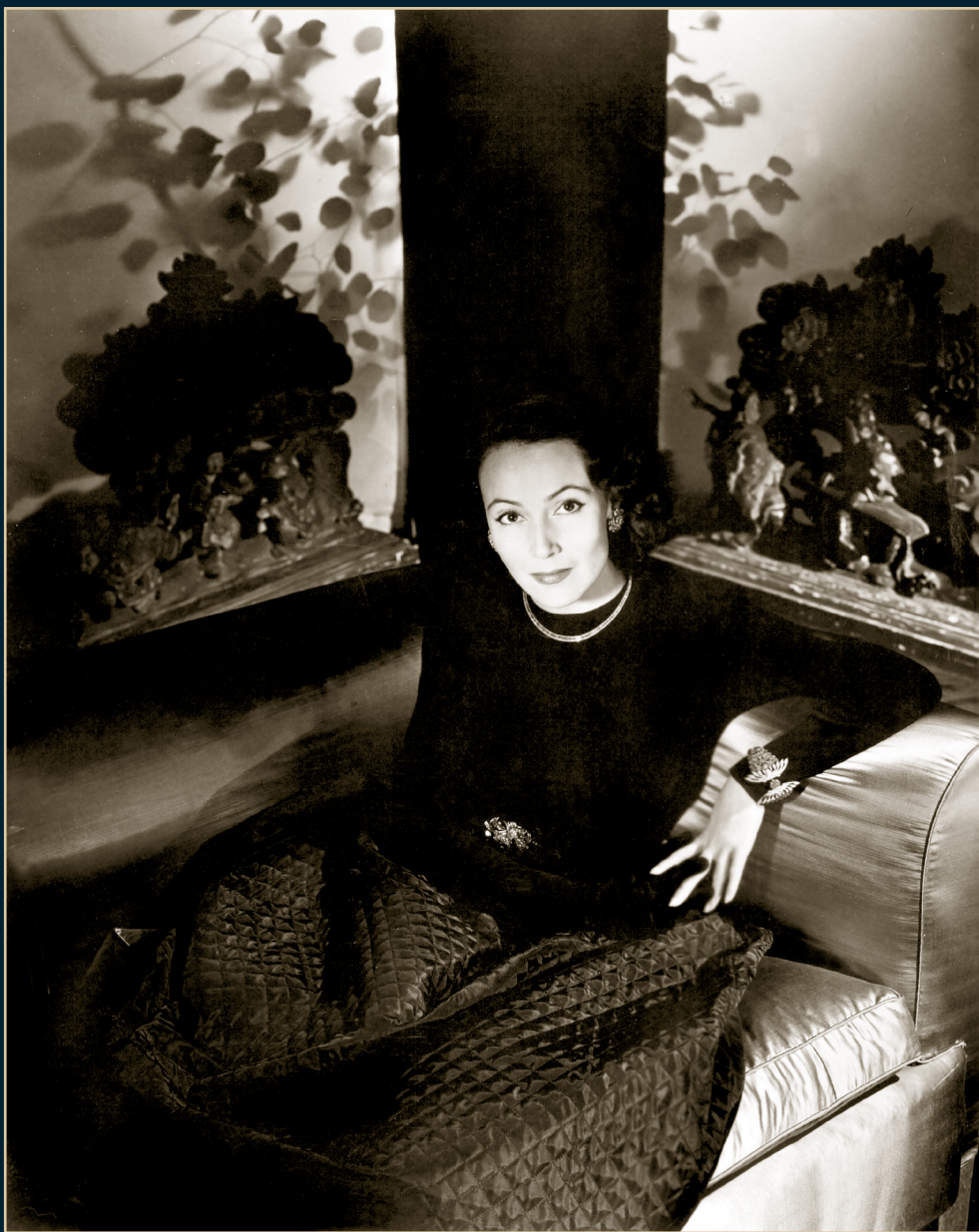
Dolores del Río, ca. 1955.