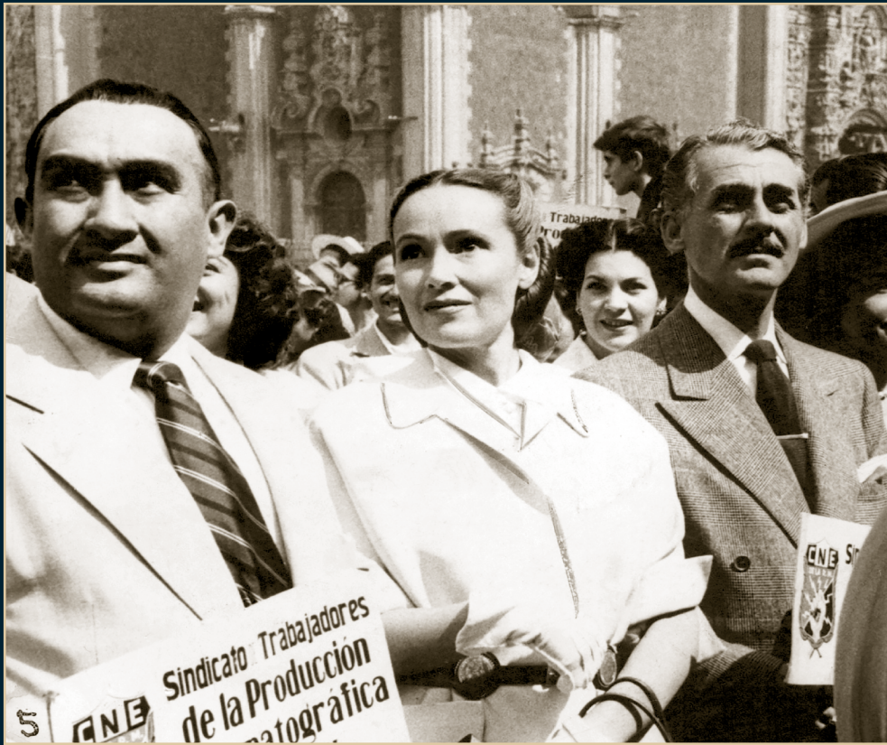
Artistas desfilando. 2 de mayo de 1951. Cinematografía, Pedro Vargas, Dolores del Río, Julián Soler. Mayo 2 de 1951.