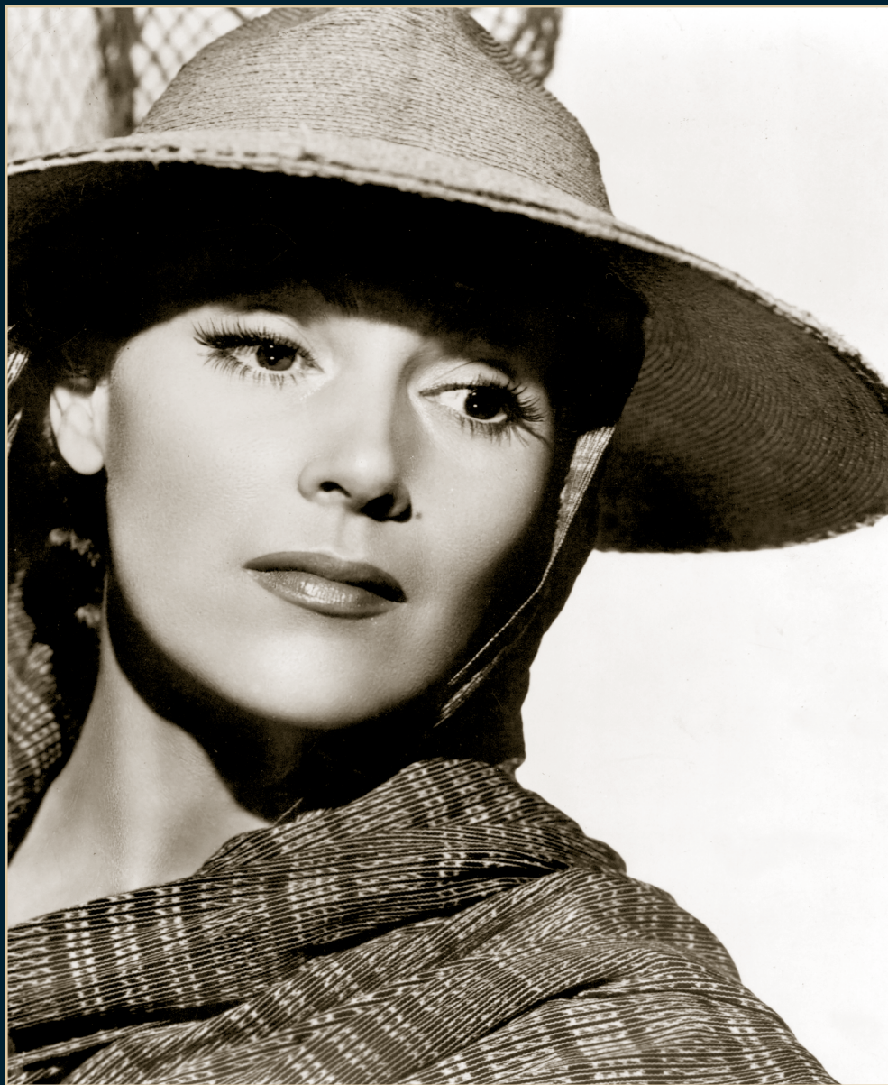
Dolores del Río, María Candelaria, 1943.