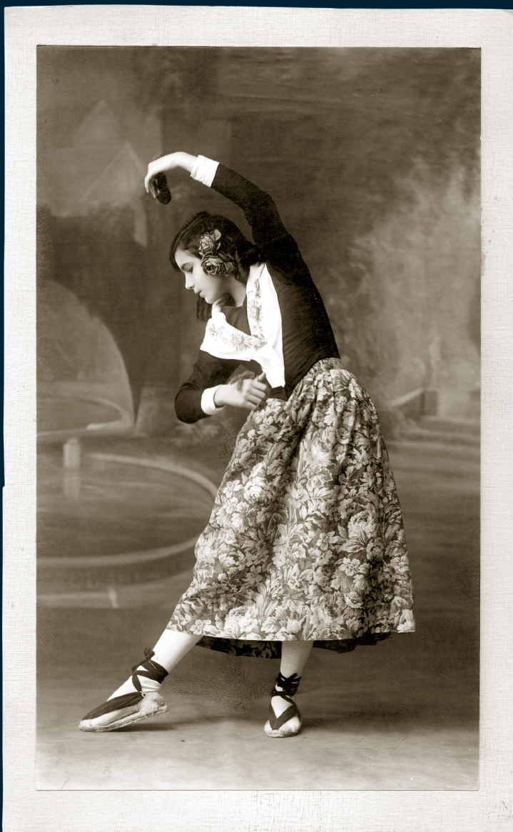
Dolores Asúnsolo López Negrete, vestida de "Española" en su clase de danza. No. Fondo: MXXIV-3. Fondo: Dolores del Río. Clasificación 090: MXXIV-3.1.30. Año: 1904-1923. S/1, 1918. Serie: Fotografías. CEHM-Carso.