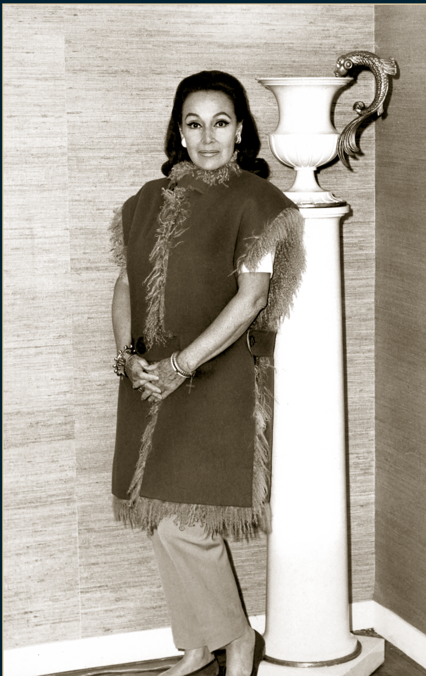
Dolores del Río, mayo de 1983.