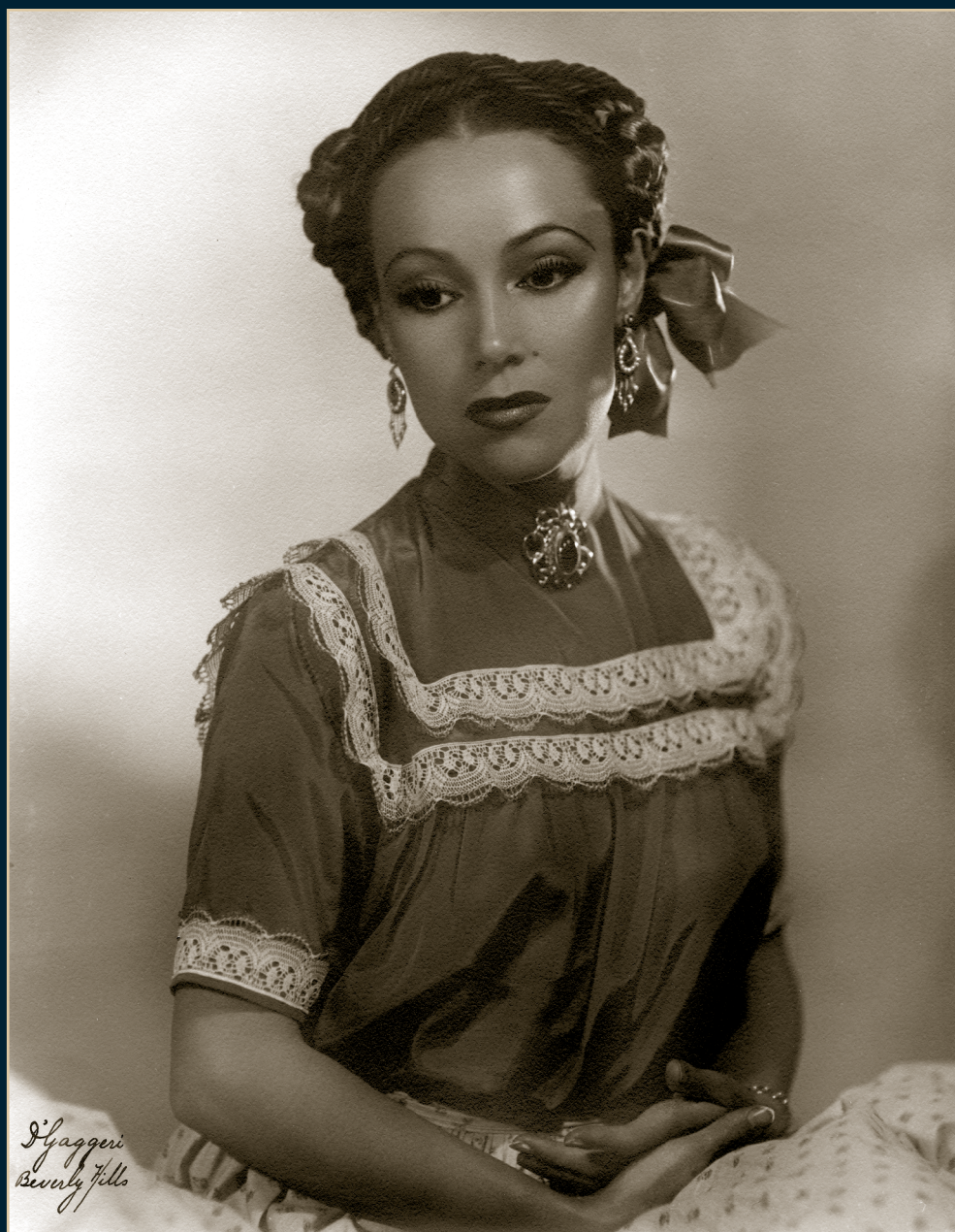
Dolores del Río con un peinado inspirado en Oaxaca. No. Fondo: MXXIV-3. Fondo: Dolores del Río. Clasificación 090: MXXIV-3.10.1104. Año: 1936-1938. S/I, 1938. Serie: Fotografías. CEHM-Carso.