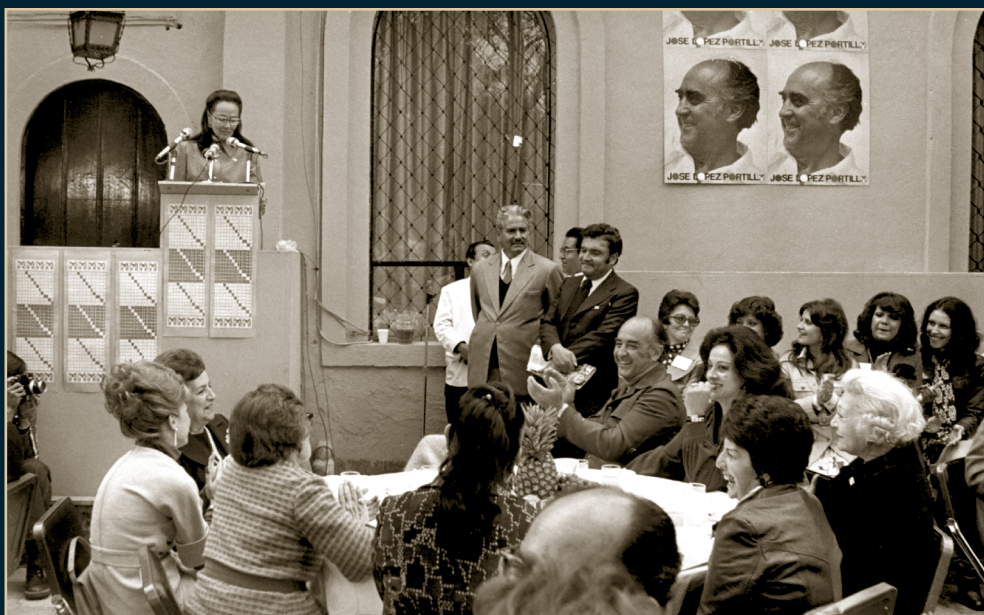
Dolores del Río. 13 de noviembre de 1975.