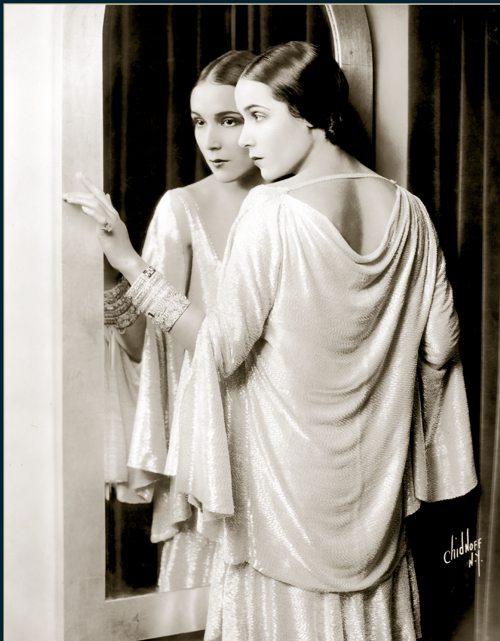
S/T, Fondo Dolores del Río, Álbum 1107, 1929, SECRETARÍA DE CULTURA-CINETECA NACIONAL.