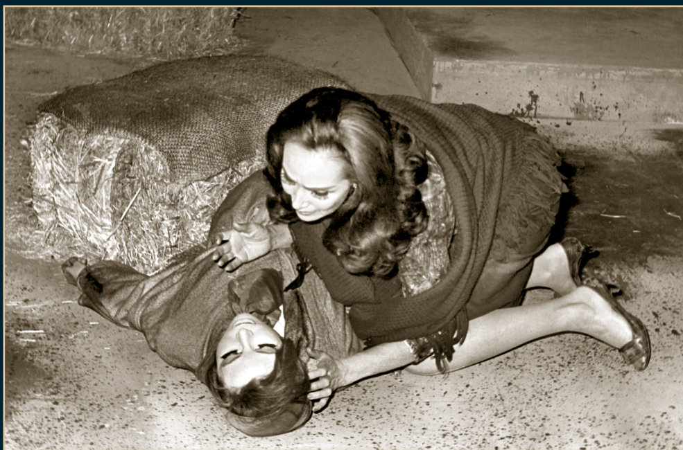
Dolores del Río en una escena de La Reina y los Rebeldes. 19 de septiembre de 1967.