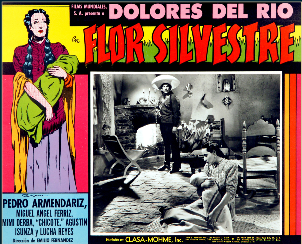
"Flor Silvestre", Fondo Dolores del Río, Archivo: FNH-0074-001. SECRETARÍA DE CULTURA-CINETECA NACIONAL.