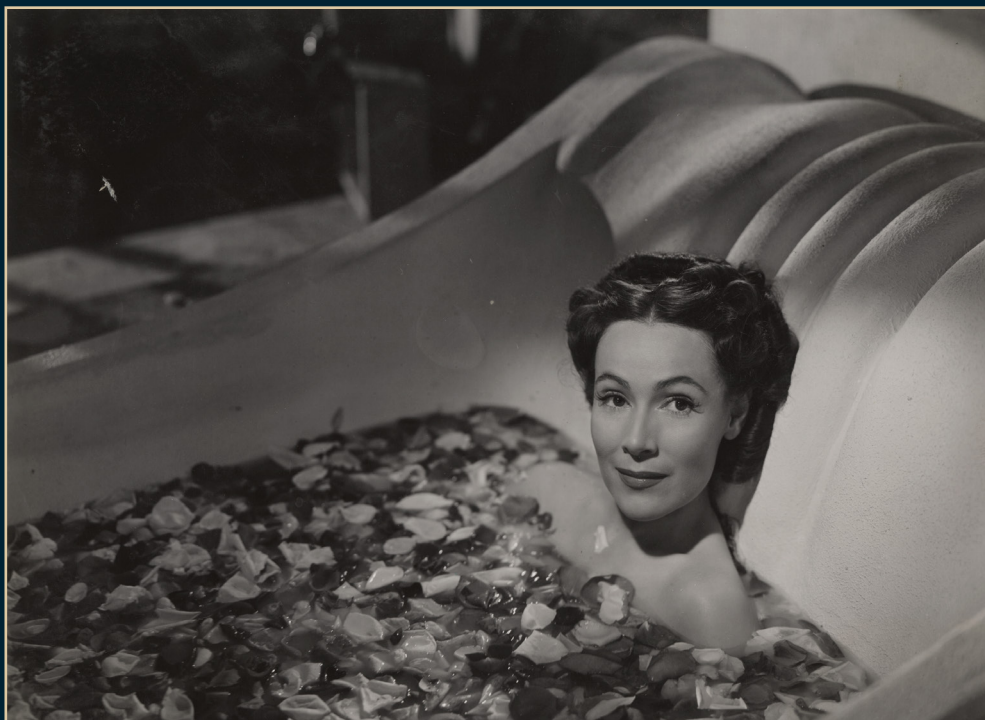
S/T, Fondo Dolores del Río, Álbum 11026. SECRETARÍA DE CULTURA-CINETECA NACIONAL.